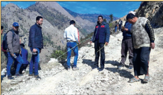
मल्लरानी गा.पा १ देउराली देखि थाम सम्मको मो.बा सर्भे गर्दै गाउँपालिका प्राविधिकहरु