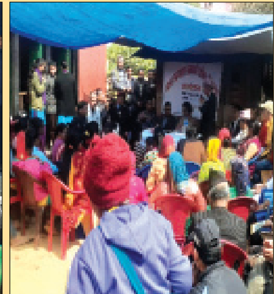
वडा स्तरमा भएको न्याय सम्पादन सम्बन्धी अभिमूर्खिकरण कार्यक्रमहरु