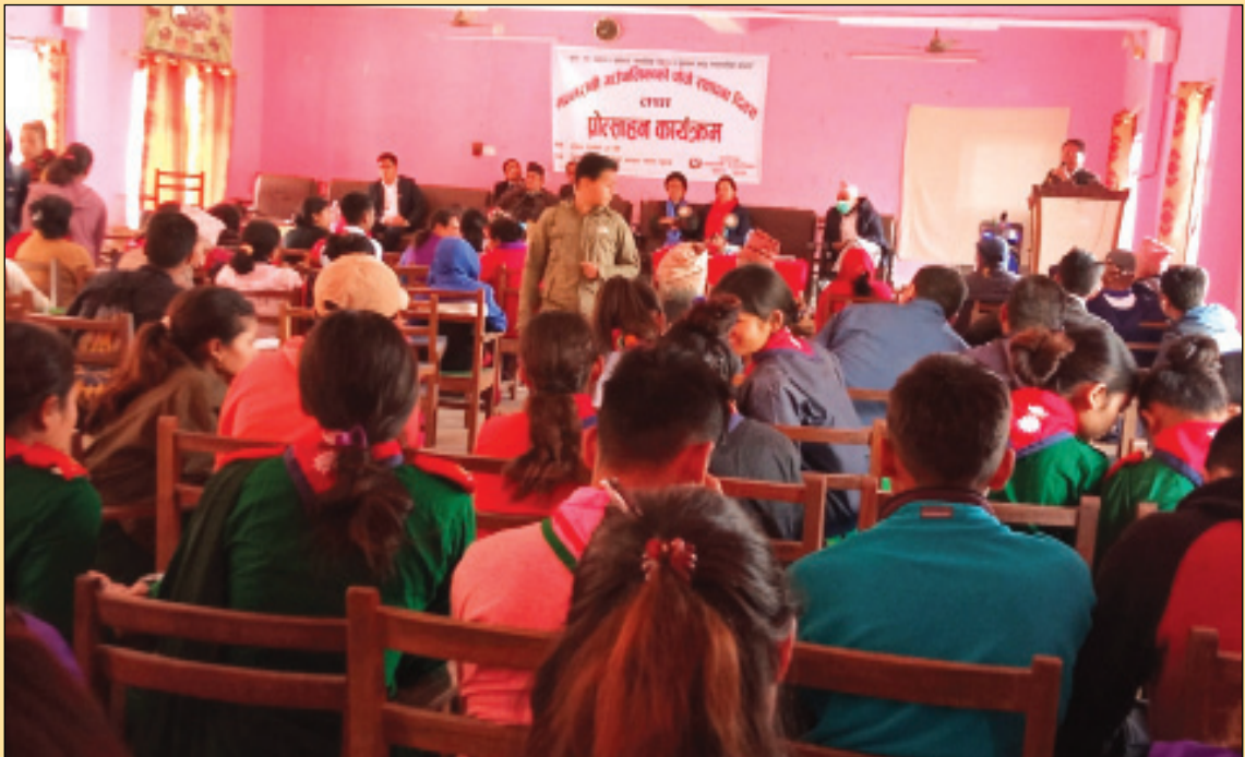
गाउँपालिका स्थापनाको अवसरमा विद्यालयका शिक्षक तथा विद्यार्थी प्रोत्साहन कार्यक्रम