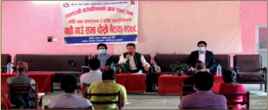
मल्लरानी गाउँपालिकाको नवौँ गाउँसभा २०७८