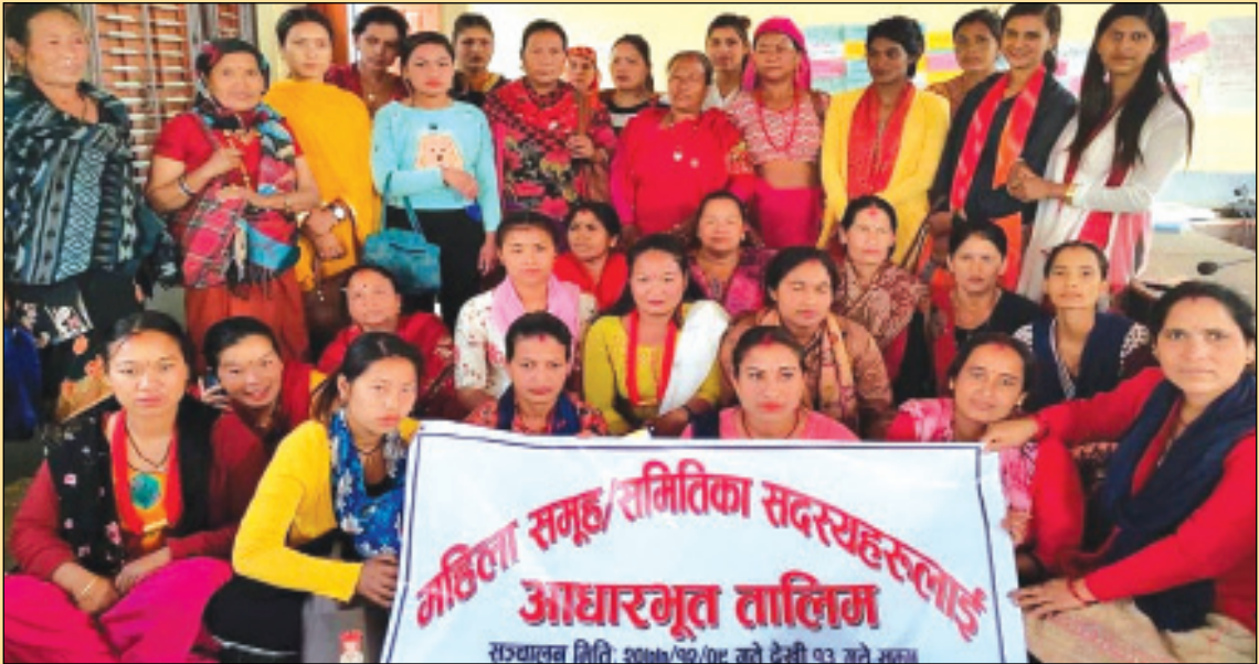
महिला समूहका सदस्यहरुका लागि ५ दिने आधारभूत तालिम सञ्चालन