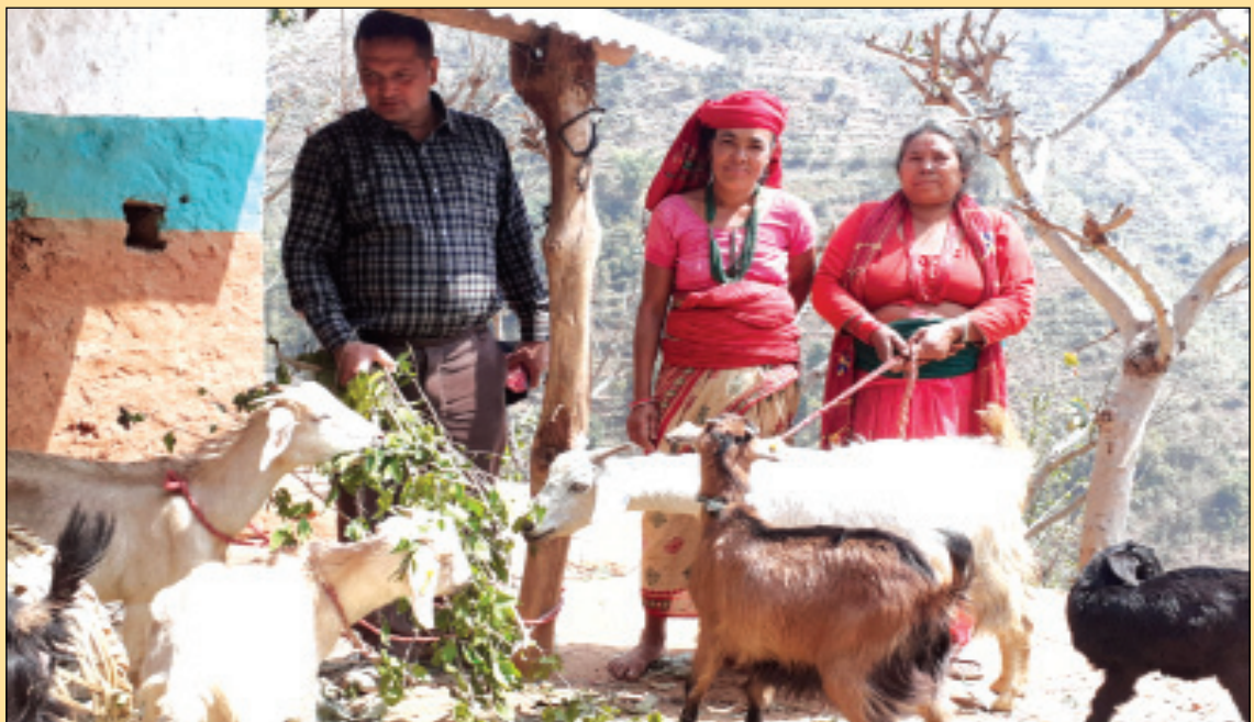
लागत साभेदारिमा मल्लरानी गा.पा वडा न १ तिसाचुलि बास्रापालन समुह अनुगमन गर्दै