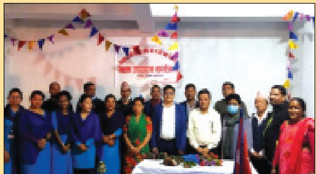
वडा नं २ को नव निर्मित वडा भवन उद्घाटन कार्यक्रम ।