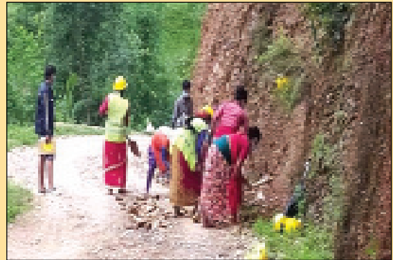
प्रधानमन्त्री रोजगार कार्यक्रमका लागि मोटरबाटो मर्मत सुधार गर्दै श्रमिकहरू ।