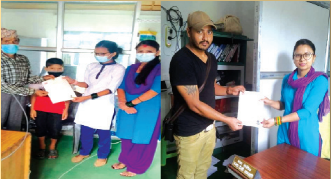
५ वटै वडाबाट अनलाईन मार्फत व्यक्तिगत घटनादर्ता गरि प्रमाणपत्र वितरण गर्दै ।