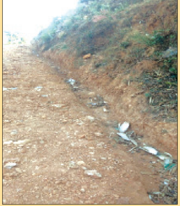
खौलेपोखरी देखि स्वास्थ्य चौकी हुँदै छेडापोखरी मो.बा स्तरोन्नती वडा नं २