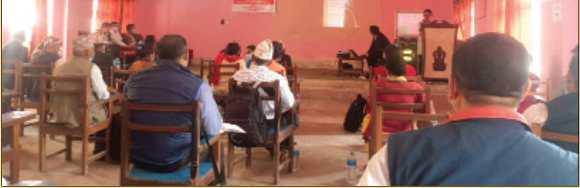
मल्लरानी गाउँपालिकाको आ.व ०७७।७८ मा संचालित कार्यक्रमहरुको प्रगति समिक्षा