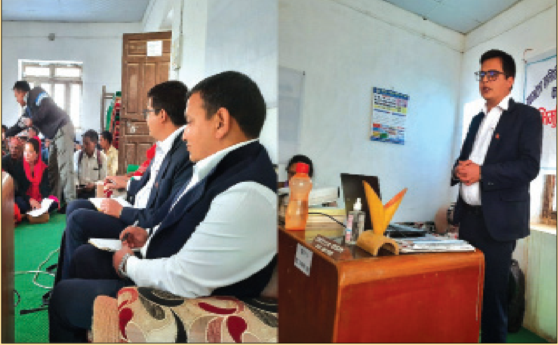
उपभोक्ता समिति पदाधिकारीहरुका लागि उपभोक्ता समितिको काम कर्तव्य र अधिकार सम्बन्धी अभिमूर्खिकरण कार्यक्रम