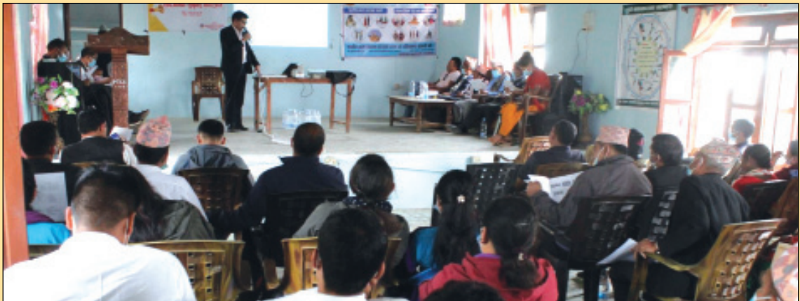
मल्लरानी गाउँपालिकाको सार्वजनिक सुनुवाई कार्यक्रम