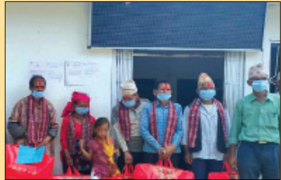
३० औ अन्तराष्ट्रिय ज्येष्ठ नागरिक दिवस कार्यक्रममा ज्येष्ठ नागरिक सम्मान कार्यक्रम सञ्चालन गर्दै वडा ।