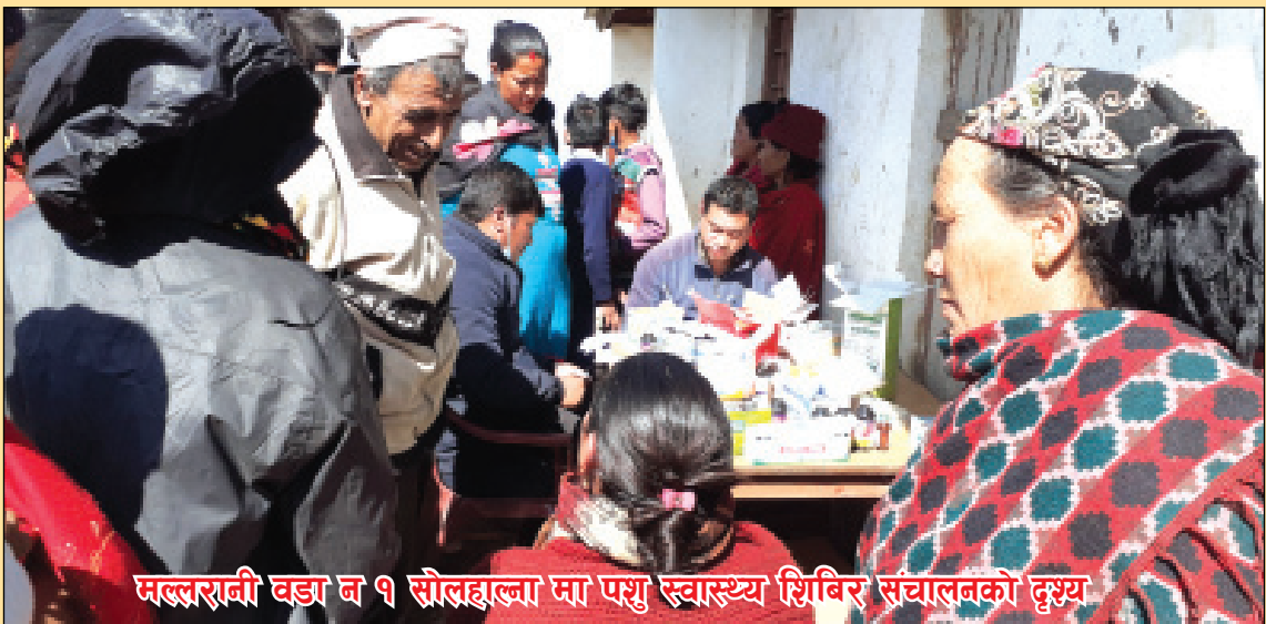
मल्लरानी वडा नं १ सोलहवा मा पशु स्वास्थ्य शिविर संचालनको दृश्य