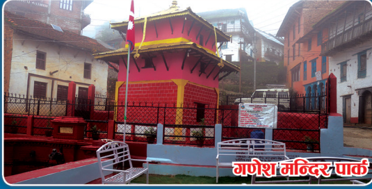
गणेश मन्दिर पार्क