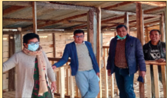
मल्लरानी गाउँपालिका वार्ड ४ स्थित महादेवी पशुपंक्षी तथा कृषि फर्मको अनुगमन