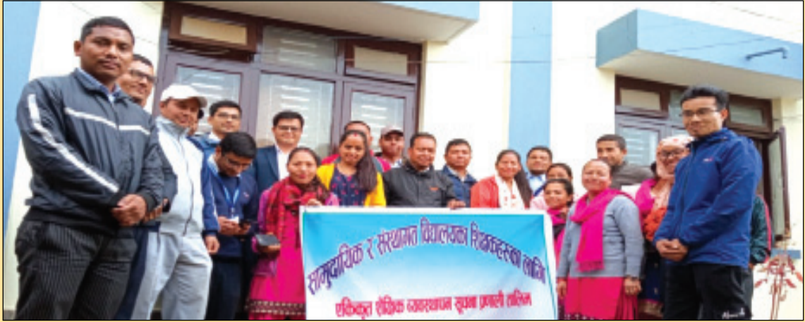
विद्यालयका शिक्षकहरूका लागि एकिकृत शैक्षिक व्यवस्थापन सूचना प्रणाली तालिम सञ्चालन ।