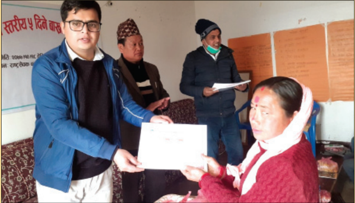
मल्लरानी गा.पा पशु शाखाबाट संचालित ५ दिने बाख्रा तालिमका सहभागीलाई प्रमाणपत्र प्रदान गर्दै प्र.प्र.अ