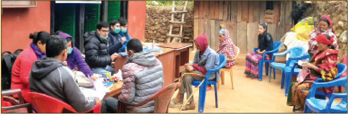
अपाङ्गता भएका व्यक्तिहरुका लागि अपाङ्गता परिचयपत्र वितरण