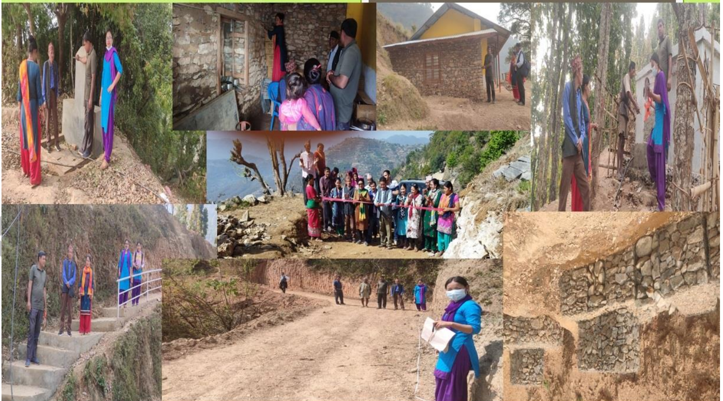
वडा नं २ बाट सञ्चालन भएका विभिन्न योजना तथा कार्यक्रमहरू