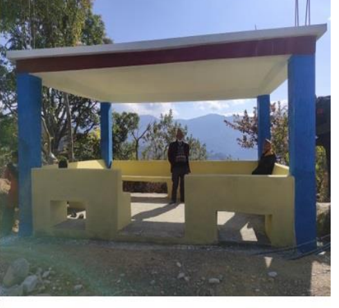
वडा नं ५ बाट सञ्चालन भएका विभिन्न योजना तथा कार्यक्रमहरु