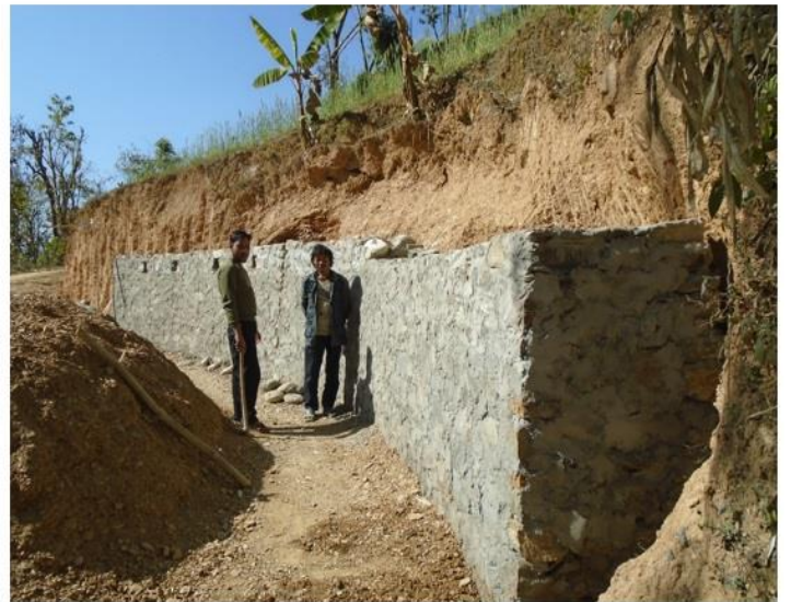
साइन डाँडा दुगेनी चौर कुलो मर्मत