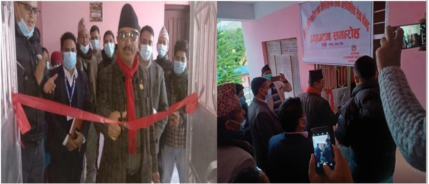
हिंसा पिडित महिला तथा किशोरी अल्पकालिन सेवा केन्द्र उद्घाटन समारोह