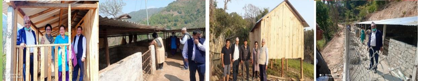
पशु शाखा बाट सञ्चालन भएका कार्यक्रमहरू