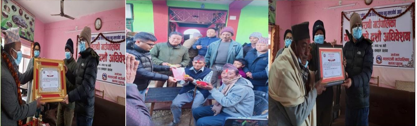
गाउँपालिकाको दशौं हिउँदे अधिवेशनमा प्रशासकीय भवन निर्माणका निम्ती जग्गादाता र कासिपानी सा.व.उ.स सम्मान लाई कार्यक्रम तथा लालपूजा हस्तान्तरण कार्यक्रम