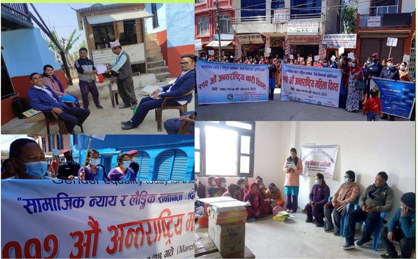
गाउँपालिकाबाट सञ्चालन भएका विभिन्न कार्यक्रमहरू