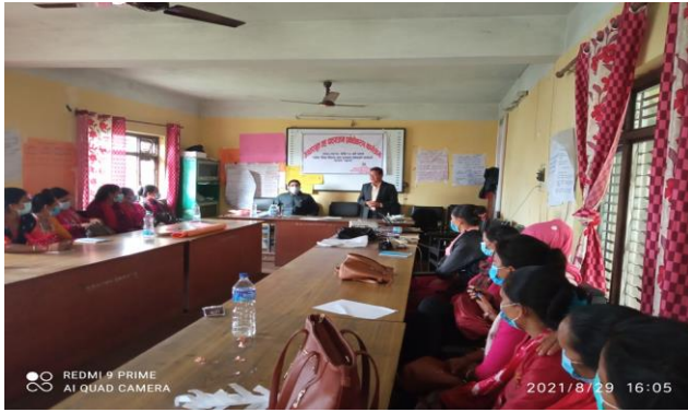
पाठ्यक्रम प्रबोधिकरण कार्यक्रम