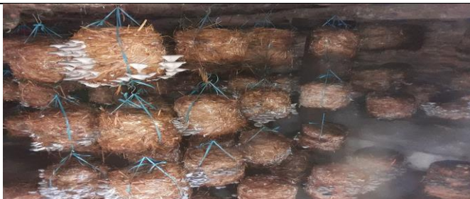
मल्लरानी ४ का कृषक सपना पोखेल ले च्चाउ खेति को लागी च्चाउ मुड़ा तरायर गरेको