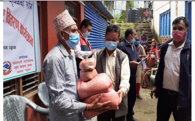
सुचिकृत कृषक समुह तथा व्यवसायिक फर्महरुलाई हिउँदे (जै र बर्सिम) धाँसको बिउ वितरण