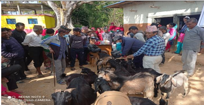
पशु स्वास्थ्य शिविर सञ्चालन