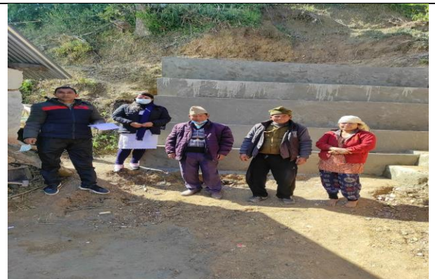
तल्लो रञ्चु पहिरो नियन्त्रण