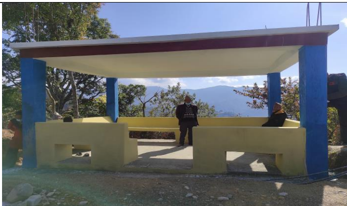
डाँडापोखरी प्रतिक्शालय निर्माण