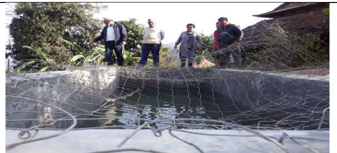
साना सीचाई कार्यक्रम अन्तरगत मल्लरानी ३ मा संचालित नबिन पशु तथा कृषी समुहमा निर्माण गरिएको पोखरी