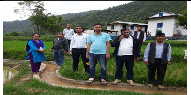
धान पकेट अन्तरगत निर्माण गरिएको सीचाई कुलो मल्लरानी ५ धुदी