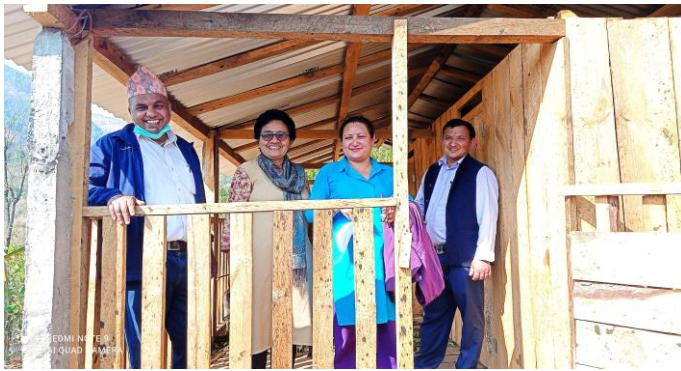
व्यवसायिक बाखापालन कृषकहरुको खोर अनुगमन