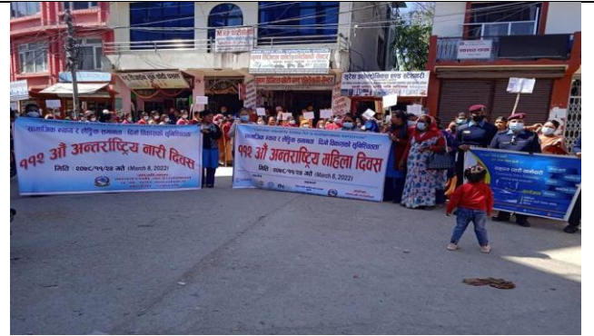
नारी दिवस कार्यक्रम