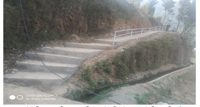
चुजाठाटीदेखि पालुसिद्ध प्रा.वि जाने सिडी तथा रेलिड निर्माण