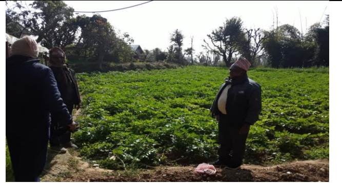
साना सीचाई कार्यक्रम अन्तरगत मल्लरानी ३ मा संचालित नबिन पशु तथा कृषी समुहमा निर्माण गरिएको पोखरी