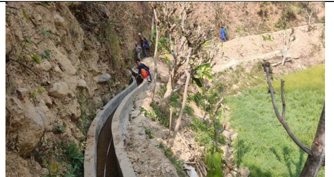
झाएवर रुख अर्चले सि. कुलो