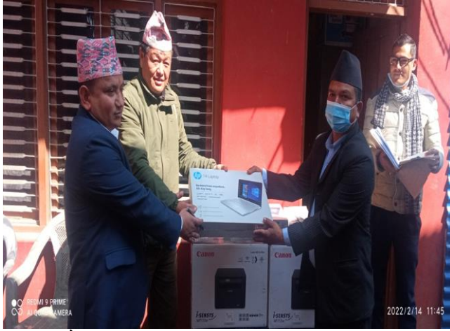
प्रविधी मैत्री विद्यालय कार्यक्रम अन्तर्गत विद्यालयहरुमा ल्यापटप प्रन्टर वितरण ।