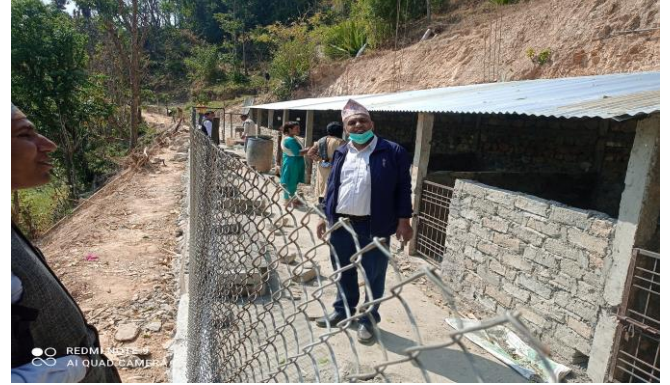
व्यवसायिक बैंगुरपालक कृषकहरुको खोर अनुगमन