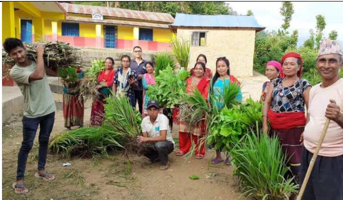
सुचिकृत फर्म तथा कृषक समुह हरुलाई बहुवर्षिय भुँई तथा डाले धाँस(मुलाटो,सुम्भा सेटारिया,नेपियर र सिड्लेस किम्बु) वितरण