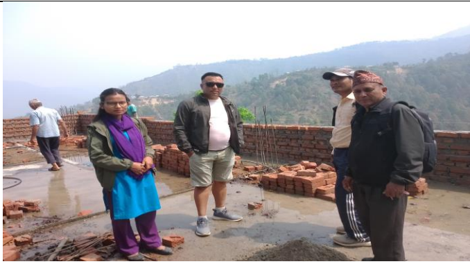
सत्यदेवि अतिथि भवन निर्माण पाण्डेडाँडा