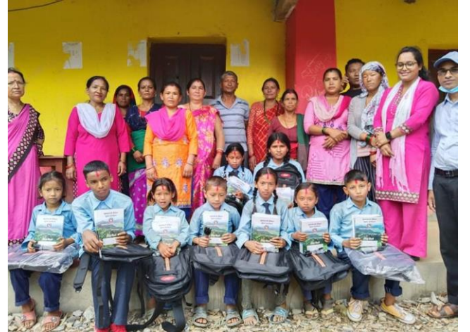
विपन्न असहाय गरिव बालबालिकालाई स्टेशनरी वितरण