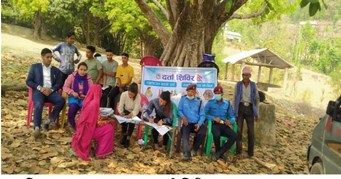
सामाजिक सुरक्षा तथा घटना दर्ता शिविर