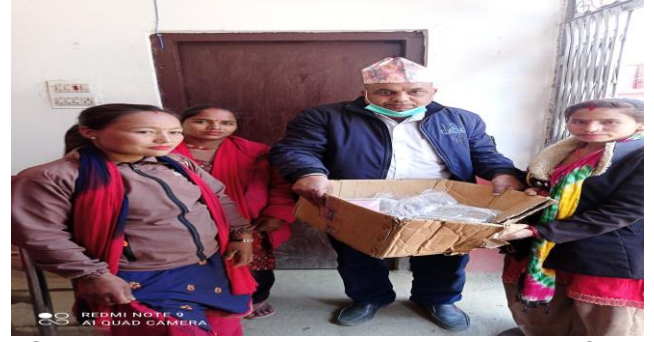
सुचिकृत कृषक समुह तथा फर्महरुका कृषकहरुलाई खनिज ढिक्का वितरण