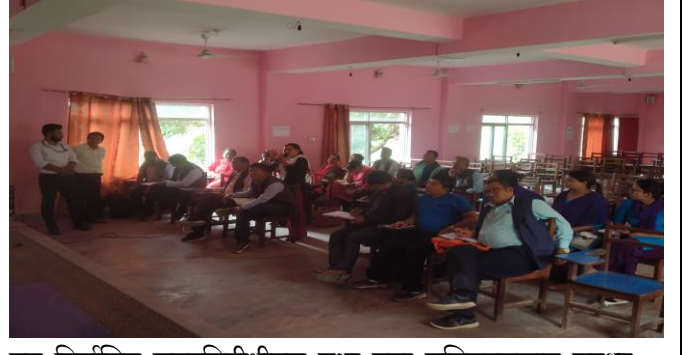
नव निर्वाचित जनप्रतिनीधीहरू तथा वडा सचिवहरूलाई सुरक्षा तथा घटना दर्ता सम्बन्धी अभिमुखीकरण