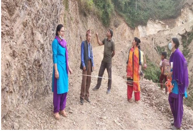
जगदम्बा काप्रादिप मो.वा.