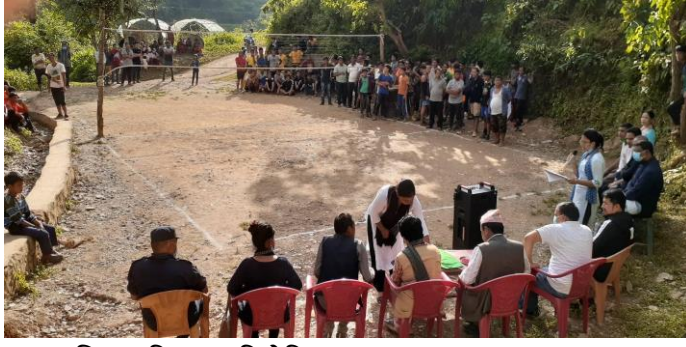
युवा लक्षित भलिबल प्रतियोगिता