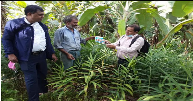
आकस्मिक बाली संक्षण कायक्रम अन्तरगत किसान को बारीमा गइ उपचार सेवा दीदै